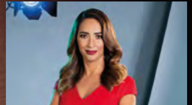
PAOLA VIRRUETA CONDUCTORA UNIVISION NOTICIAS